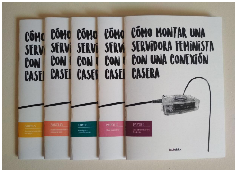
Image 1 : La_bekka, Cómo montar una servidora feminista con una conexión casera (Comment configurer un serveur féministe avec une connexion à domicile), 2019, https://labekka.red/novedades/2019/11/05/lanzamiento-fanzine.html .