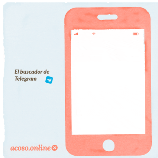
Image 3 : Acoso.online (Harcèlement.online), Étape 2 : Tapez @AcosoOnlineBot dans le moteur de recherche de Telegram., s.d., https://acoso.online/cl/chat-de-ayuda/ (consulté le 5 avril 2021).